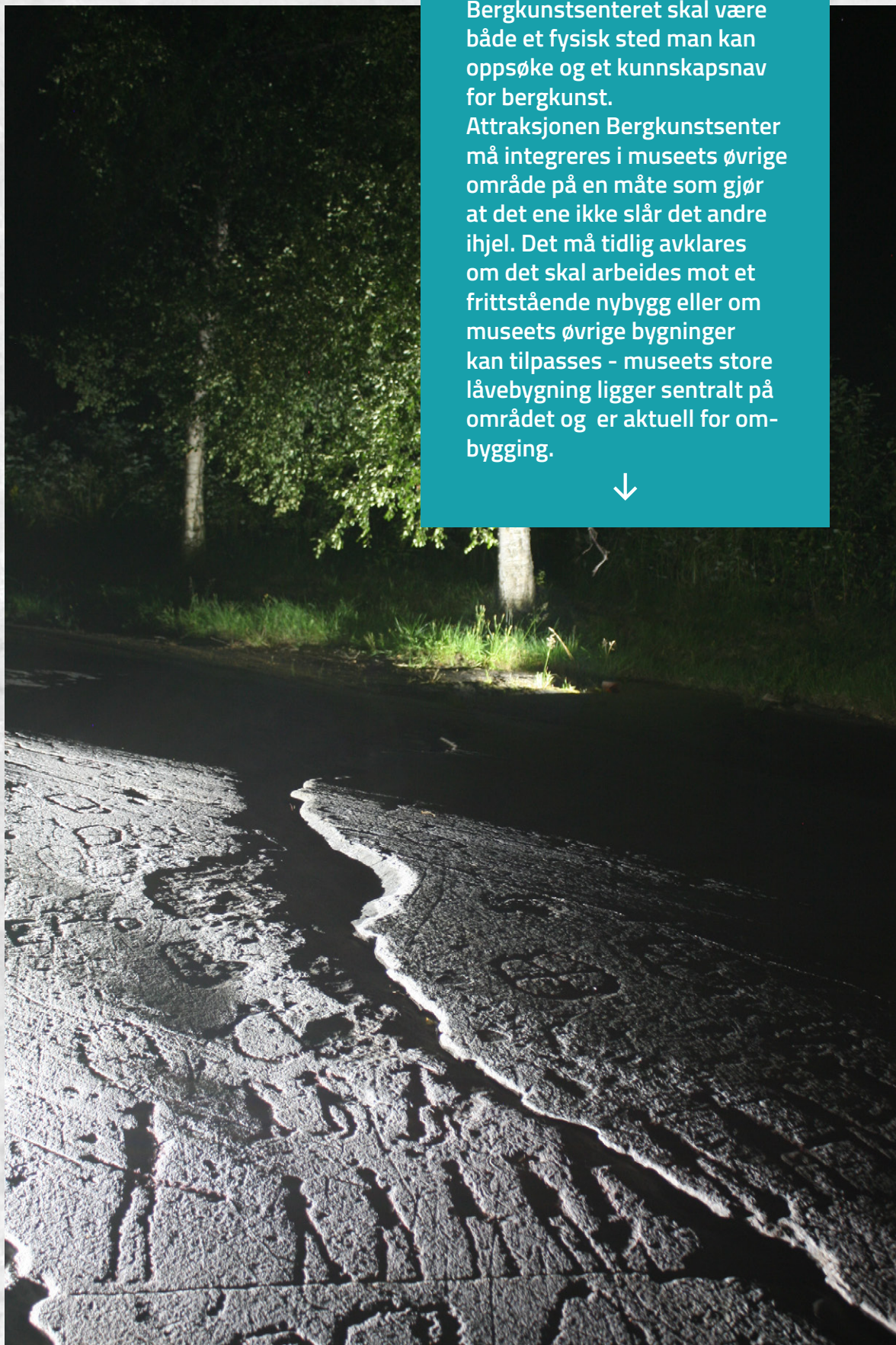
● Detalj fra det store bergkunstfeltet på Leirfall ved Hegra i Stjørdal.