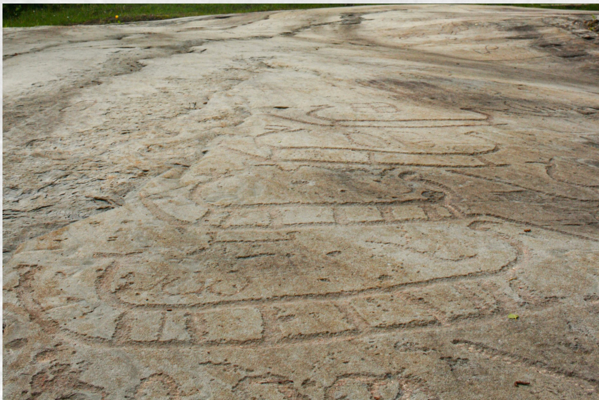
● Detalj fra det store bergkunstfeltet på Leirfall ved Hegra i Stjørdal.

Estimert tidsbruk på prosessen er 3-4 år, før åpning i 2024 eller 25. Arbeidet med Bergkunstsenter vil legge bånd på store administrative ressurser i perioden, og det er derfor essensielt å prioritere hvilke andre utviklingsoppgaver museet har anledning til å gjennomføre ved siden av normal drift. Det arbeides for å løse ut midler til å drive prosessen også, for at det ikke skal belaste museets øvrige drift. Det vil være ideellt om det kan finnes midler til en mindre prosjektstilling. Det er avsatt statlige og kommunale midler på til sammen ca 17,5 millioner kroner til senteret. Stjørdal kommune har vedtatt økning i driftsmidlene til museet på 500.000 pr. år når senteret er åpnet, og det er en forventning om at staten også følger opp med økte driftsmidler. Det er et mål at museet kan øke sin grunnbemanning med én stilling, det vil være behov for personalressurser på formidling og i publikumsmottak.