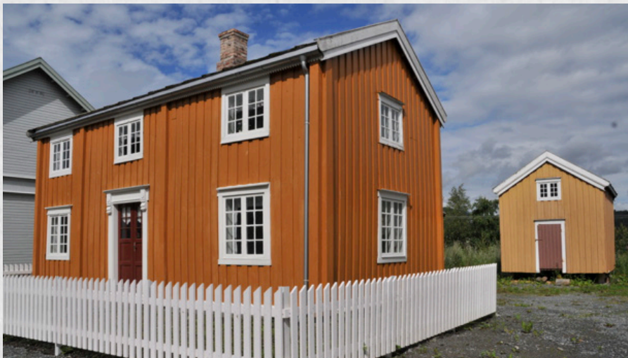
● Noen av bygningene i Hæsjgata: Ingebrigtsengården med stabbur