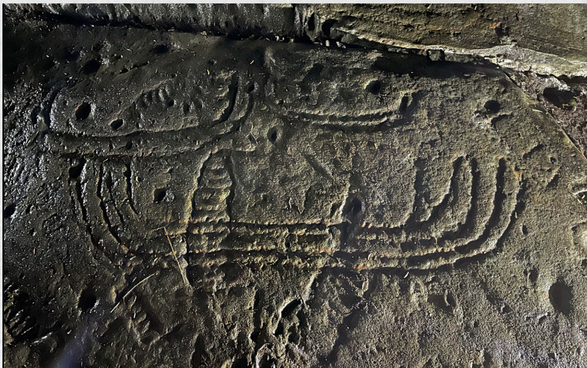
● Fra nattlysning av bergkunstfeltet på Nessiaunet i Stjørdal