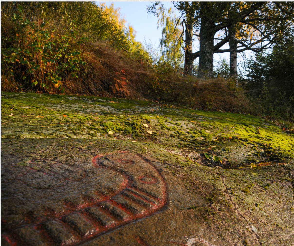
● Detalj fra det store bergkunstfeltet på Leirfall ved Hegra i Stjørdal.